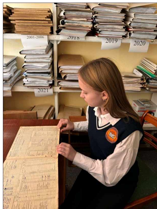
Праца ў архіве Граўхышкоўскага сельскага савета